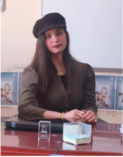
علاما جمد كاظم جامعة بغداد - كلية الاداب

ان التعامل مع الهوية يقرر مجموعة من الاجراءات عند الروائي. وهذه الاجراءات تتطلب ان يظهر الكاتب محددات للشخصيات والفضاءات. وانعام كجة جي لجأت الى هذه القضية عندما اظهرت الدكتوراة وردية، وقد تخصصت بمجموعة من المحددات تظهر هويتها الدينية اولا، والوطنية ثانيا، جذت الروائية على اظهار الانتماءات الاثنائية في تصويرها لشخصية البطلة وردية، وروحها الوطنية المشتركة بين المسلمين والمسيحيين التي كانت سائدة انذاك. فروح المحبة والتعاون تولد حالة الحب الوطنية المشتركة في الثانوية تعرفت وردية الى معاني حب الوطن. وكان في صفها اربعة طالبات مسلمات واثنان مسيحياتان وسبع عشرة يهودية انها المكلفة بجمع التبرعات لضحايا المظاهرات من الطلبة الجرحى برصاص الشرطة. لا تتأخر في الذهاب الى اليهوديات فتبرعن، مثل الاخريات، على مضض او عن طيب خاطر.... ولم تكن الصراعات السياسية في تلك الفترة المبكرة، قد افسدت النسيج الاجتماعي البغدادي.... تأتي زميلاتها المسلمات واليهوديات لمعايبتها في عيد القيامة. يجلسن في غرفة الخطار مثل الكبار. يشربن الشاي وياكلن الكليجة. فانعام كجة جي قد تضع رؤيتها الخاصة من خلال خطاب الذات حين تقدم وضع رؤية الكاتب للشخصيات المسيحية لتعبر عن الروح الوطنية من خلال الطيبة وردية فاتخذت البيئة التي تعيش فيها منطلقا لمعرفة مناخها السائد، الذي كان يتميز باندماج الهويات الفرعية مع بعضها. فالطالبات كن من اديان مختلفة، والحدث الثوري والوطني، ووجود الجرحى، يدل على حدث وطني يشمل الكل. ومعنى جمع التبرعات هو التلاحم الوطني، ومشاركة المسلمات في اعياد المسيح، هو اعتراف واعتزاز واحترام من قبل الديانات الاخرى وحبهم للاخر.